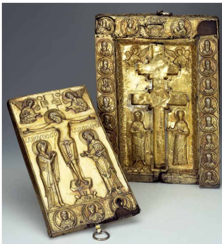
Ил. 6. Византийски реликвиарий на Светия животворящ кръст, чиято украса повтаря описаната сцена на Кръста, Константин и Елена, и ангелите. 13 в. (С-Пб. Ермитаж).

17. На същия тази Форум стояла внушителна статуя /стела/ на слон, в пространството отляво, близо до великата статуя /стела/ 50 . Той представлявал странна гледка /теама/. Веднъж имало земетресение и слонът паднал и си счупил един заден крак. Войниците на префекта, защото Форумът е в неговата сфера на ангажименти, извикали и се втурнали да го изправят и намерили в самия този слон всички кости на едно човешко тяло, и малка дъсчица, върху която е било написано: