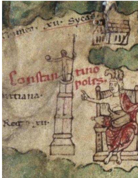
Ил. 3. Персонификация на Константинопол и колоната на Константин-Хелиос (великата статуя), многократно споменавана в текста. Певтингерова карта.

11. От Великата църква, която сега се нарича „Света София”, били изнесени 427 статуи /стели/, повечето от които на езичници. Сред многото е имало такива на Зевс и на Кар 34 , наследника на Диоклетиан 35 , и на Зодиака, и на Луната, и на Афродита, и на Северната Звезда Арктур, поддържана от две персийски статуи (стели), и на Южния Полюс, и на жрица на Атина, предсказваща на Херо, философа [изобразен] в профил. Имало и известен брой статуи /стели/ на християни, около осемдесет. От многото си струва да се споменат няколко: Константин, Констанций 36 , Констант 37 , квесторът Гален, [цезар Юлиан и още един Юлиан, епарх], август Лициний 38 Валентиниан 39 , и Теодосий 40 и Аркадий, синът му, Серапион губернаторът, и три на Елена, майката на Константин - едната от порфир и [други] мрамори, другата,