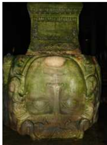
(Ил. 11. Двете Горгони от т. нар. Царски цистерни в Константинопол, съвременен вид)