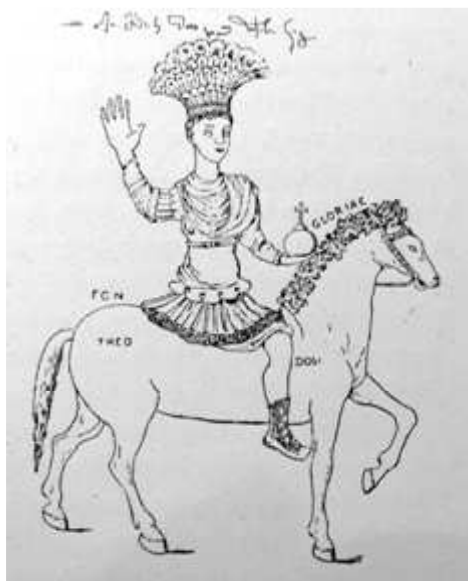
Статуя на Теодосий или на Юстиниан, или на Ираклий, или на Константинополския Genius Loci (рисунка - Кириак от Анкона, ок. ср. на 15 в)