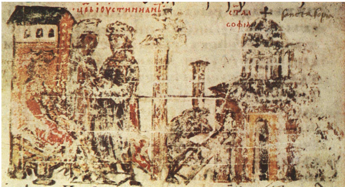
Ил. 4. Построяването на „Света София“ от цар (император) Юстиниан. Български препис на Манасиевата хроника , миниатюра 38 (14 в.)

инкрустирана със сребро на бронзова колона и третата от слонова кост, дарена от ретора Киприй. Тези статуи Юстиниан 41 разпределил из града, когато построил Великата Църква с вяра и усилие (4). Онези, които знаят горното, ще намерят голяма част от тези статуи, ако обиколят града и ги потърсят.