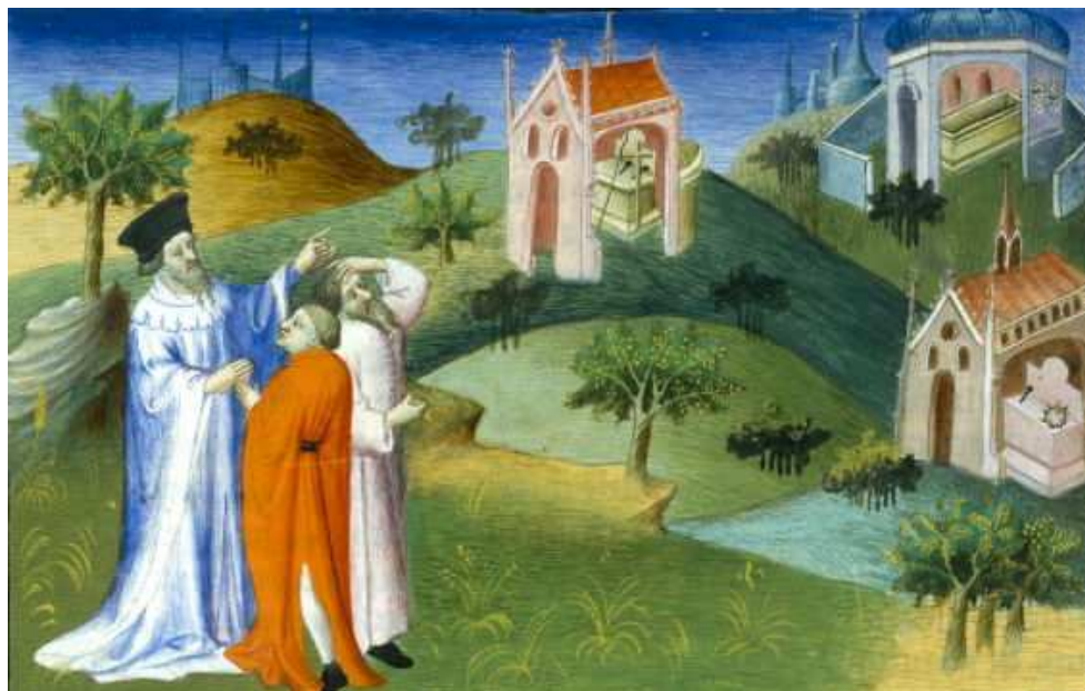
Ил. 7. Поклонници, съзерцаващи реликвите в Константинопол. Западна миниатюра, 1410-1412 г. Парижка национална библиотека.

Константин Велики и надеждно скрити от Теодосий Велики, които за по-кратко ще се въздържим да споменем поименно (Ил. 7).