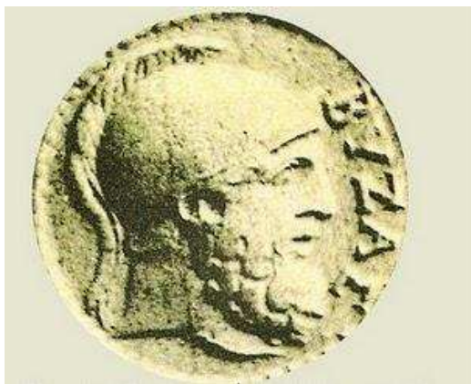
Ил. 10. Монета на Бизас, (полу)митичният основател на Бизантион.

„Пак си вдигнал камшика и сякаш пак си млад, се състезаваш лудешки в стадиона”;